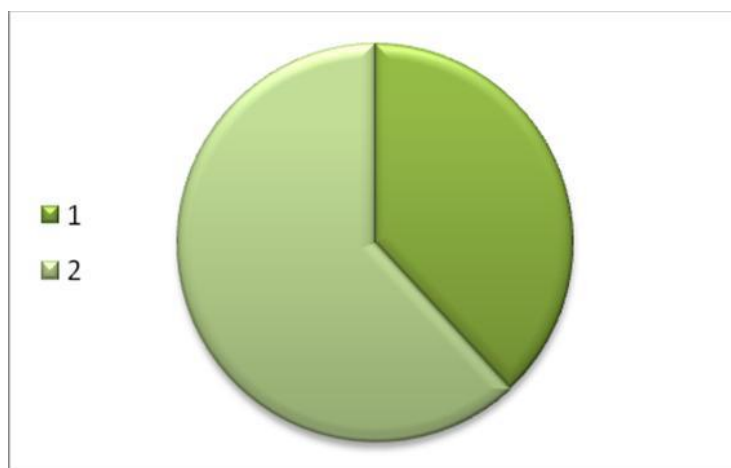
Рис. 2. Результаты опроса: 1 – Родить ребенка с предполагаемым генетическим отклонением (37%); 2 – Не обречь ребенка на неполноценное существование и сделать аборт (63%)

муж поддержал. Но меня терзали сомнения. С одной стороны - не могла предать и убить ребенка, который толкался в животике. Его же больше некому кроме меня поддержать и защитить кроме меня. С другой стороны, не давала покоя мысль о том, что мой ребенок никогда не будет иметь полноценную жизнь, что я подарю ему ее, чтобы он мучился, что когда я умру, он никому не будет нужен. Я чувствовала отчаяние. Апогея эти терзания достигли на 35 неделе, когда очередное УЗИ поставило Синдром Дауна под вопросом, из-за нервов через 3 дня после УЗИ у меня отошли воды, делали кесарево сечение. Из-за диагноза УЗИ была собрана коллегия детских врачей. Когда я проснулась после наркоза, моему счастью не было предела, ведь мне сказали, что диагноз не подтвердился, и у меня абсолютно здоровая доченька! Врачи ошибаются часто. Но даже если бы и подтвердился диагноз - своего ребенка я бы никогда не бросила и была бы рядом с доченькой до последнего вдоха».