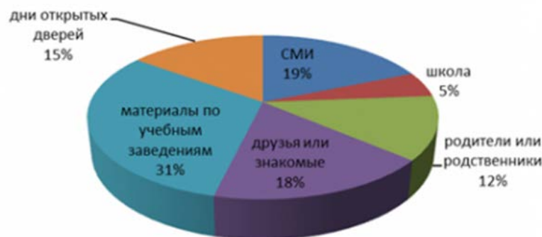
Рисунок 2. Источники получения информации о профессии (%)