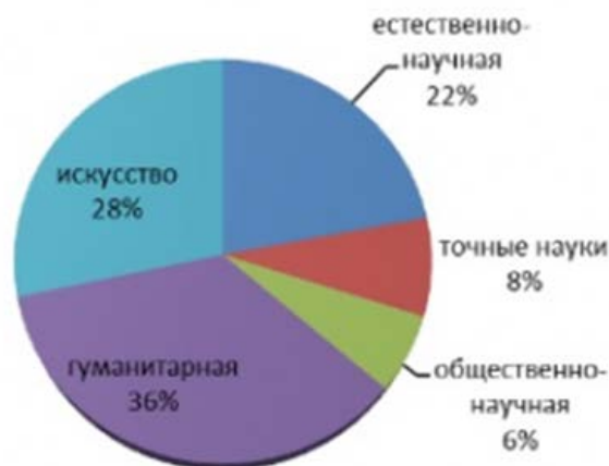
Рисунок 1. Личный интерес к различным наукам (%)

Практически все студенты уверены в своем выборе, выражают готовность работать по специальности после окончания университета, и считают, что на рынке труда имеется спрос на данных специалистов (56%). 17% опрошенных полагают, что данная профессия не востребована, и 27% респондентов отметили вариант ответа – «не знаю».